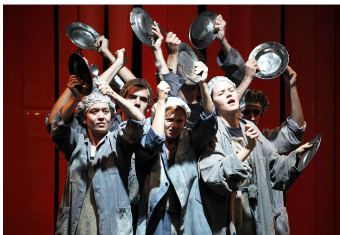
Elenco integra alunos finalistas do Conservatório e da ACT.