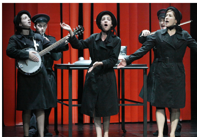
As músicas do espectáculo são interpretadas ao vivo.

Sobre a actualidade deste espectáculo, Sobel afirma: “Este é o texto ideal para trabalhar com jovens actores. A própria realidade que se vive hoje em Lisboa, e no resto da Europa, parece saída desta peça. A partir do crash de 1929, Brecht questiona-se sobre a fatalidade do sistema em que vivemos. E tentar perceber essa fatalidade é, desde já, dominá-la”.